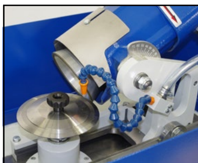
Affilatura lama circolare Sharpening circular blade Schärfen von Rundmesser